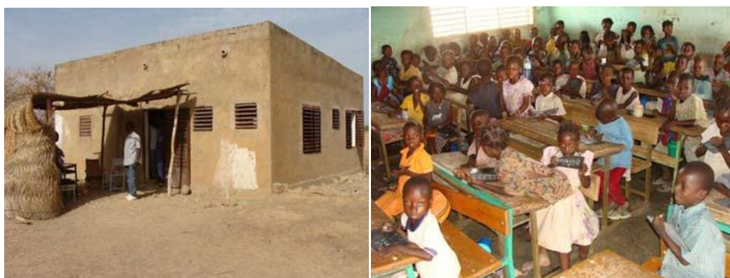
L'ancien logement du directeur sert de salle de classe - A droite une partie de la classe de CP1 Fig. 4