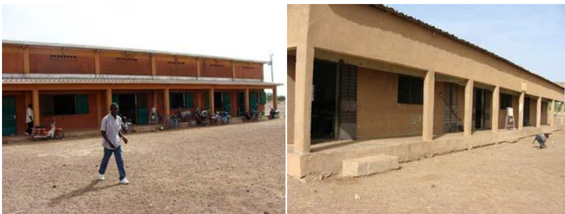
Les deux bâtiments principaux contenant en tout 6 salles de classe