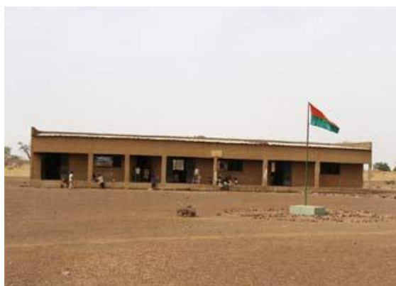
Le bâtiment sera construit à l'identique, à droite de celui-ci Fig.8