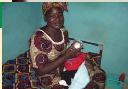
Enfant de la pouponnière

Le Centre d'Eveil et d'Education Préscolaire Privé Den Kanu a ouvert une 3 ème classe. Les jeux d'éveil et d'éducation qui ont été envoyés par conteneur sont bien arrivés et ont pris place sur les étagères prévues à cet effet. Ce matériel éducatif est largement utilisé et le chant et le respect de son voisin tiennent une grande place dans le programme de la journée. Les enfants sont assis sur des nattes en attendant la prochaine arrivée des tables et chaises en janvier 2011 . 3 mamans bénévoles assurent le cantine , et apprennent à se servir d'une cuisinière à gaz.