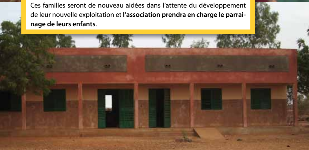
Ecole de Bokin