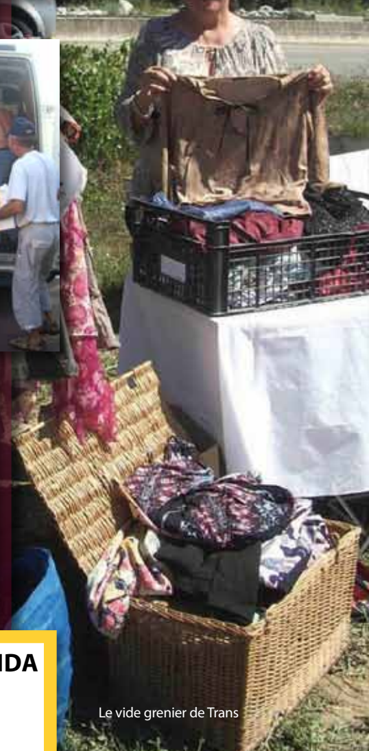
Le vide grenier de Trans