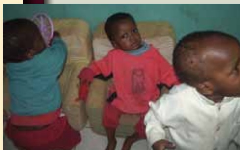
La cour de récréation du centre d'éveil