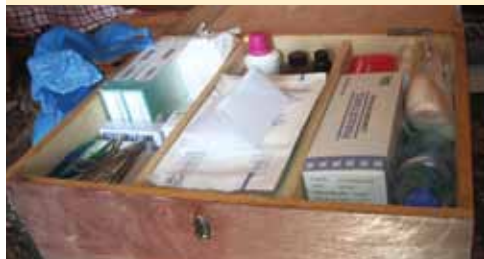
La pharmacie école sarfalao 2010

La pharmacie scolaire a été renouvelée, (coton, bandes, compresses, alcool, éosine, efféalgan) les dates de validités vérifiées et les produits périmés ont été détruits.