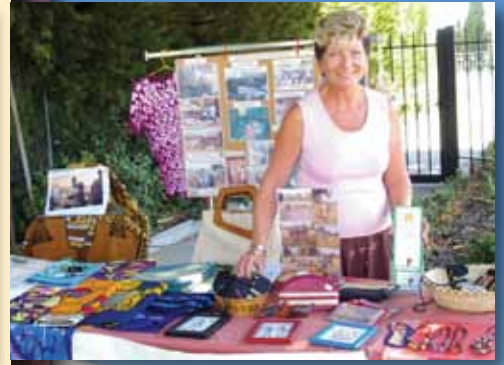
Exposition Chateaufort de Grasse