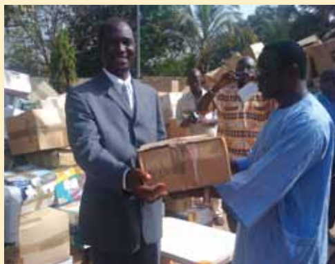
Arrivée du conteneur