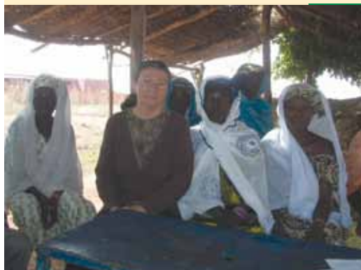
La réunion Coopérative femmes de ZIIGA 2010