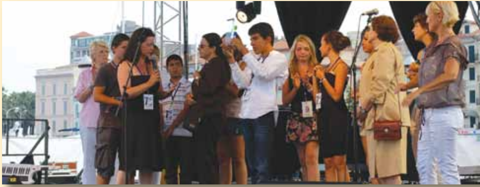
Remise du prix spécial à Cannes

L'Association a reçu le prix spécial du Jury du FESTIVAL INTERNATIONAL DES DROITS DE L'ENFANT , qui s'est déroulé le 26 et 27 juin 2010 à CANNES. C'est un formidable encouragement et une reconnaissance du travail fourni par l'Association, dont la priorité est toujours d'améliorer le quotidien de la vie de quelques enfants afin de transformer le rêve d'un avenir meilleur en réalité dans son pays d'origine.