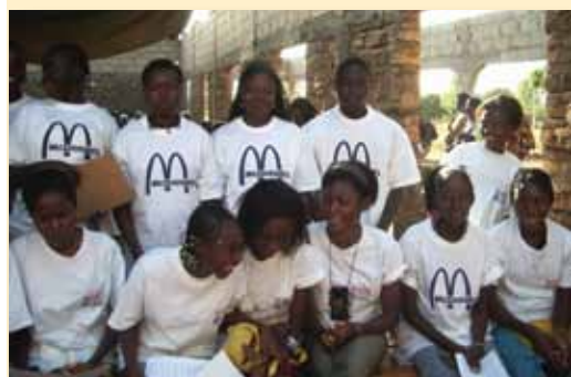
La chorale habillée en Mc Donald's

La répartition des bénéfices se fait une fois les sacs achetés pour l'ensachage de la prochaine récolte. Chaque famille trouve ainsi fierté et dignité de pouvoir envoyer les enfants à l'école grâce à leur nouvelle autonomie .