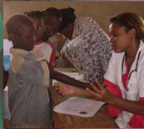
La visite médicale dans la classe