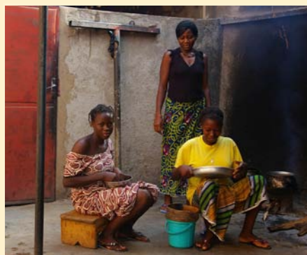
La cantine dans la cour