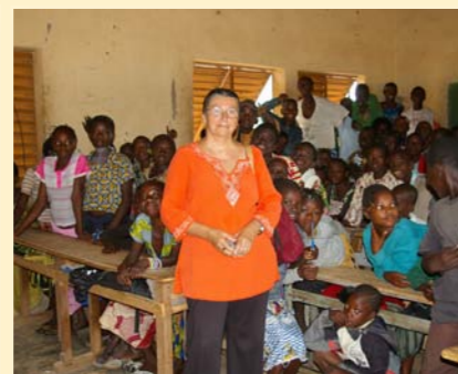
Ecole de Sarfalao B