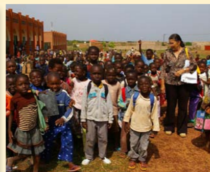
Ecole Kua G