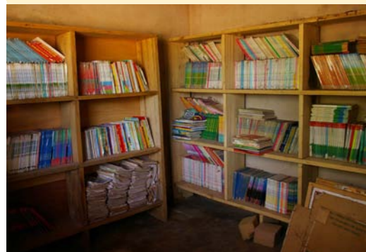
Bibliothèque de Sarfalao B

C'est dans cette école qu'ont été remis les TS de l'Association CANNES JEUNESSE ainsi qu'une fresque banderole peinte par les enfants du Centre aéré de TARADEAU en été 2011, en échange de celle peinte par les enfants de KUA G actuellement en cours de réalisation.