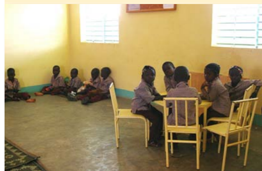
Préscolaire Den Kanu